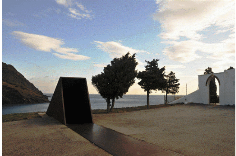
Dani Karavan - Memorial Walter Benjamin - Port Bou (vista lateral) 9