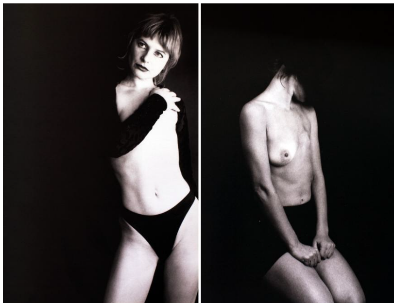
Imagen 2. Escrita fotográfica.

Si en su primer libro Recursos humanos habría señalado que el cáncer era una experiencia (no una enfermedad) que la había movido pero a su vez dejado en el mismo lugar, en el “Prólogo” de Efectos colaterales dirá que lo que procuró fue cambiar de posición. En todo caso buscó jugar con las posiciones de lo femenino: “(desde lo estándar de la imagen femenina hasta el andrógino, pasando por chistes, estereotipos eróticos, y más chistes) con la esperanza de trascender justamente la cuestión de las poses” (2003, s/n). La fotografía escenifica la búsqueda de otros lugares, la experiencia “todas las poses posibles” (2003, s/n). Si se trata de escribir es necesario un otro. En este caso, escritora, fotógrafa y modelo tuvo que ser otra para realizar su trabajo. Se coloca como objeto para la cámara y ante el espectador, pero también hace presente un Otro que dice sobre la mujer, presente en las “poses” en las que indagó en lo femenino, lo andrógino y los estereotipos de la cultura occidental y porteña. Otro fundamental es el discurso médico que, como vimos, es tomado como material de creación.