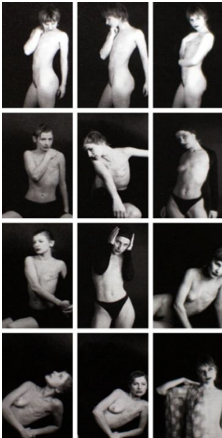
Imagen 3. Un cuerpo ¿quién ve?