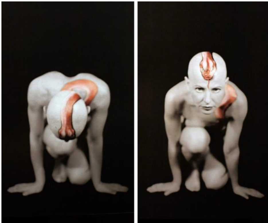
Imagen 5. Como en un sueño y a oscuras, un cuerpo con serpiente.

Lo primero que surge al mirar la fotografía es una mujer que no teme. Esta negación o esta posibilidad de pensar que podría temer ante la presencia de una serpiente en su cuerpo es la asociación más común para nosotros los occidentales. En seguida lo erótico. La serpiente es la culpable de la caída. Un cuerpo desnudo y una mirada provocadora, mujer y serpiente de cuerpo alargado que sugiere ondulados, superficie destinada al tacto y al deseo. Muy debajo del escalafón de seres vivos, rastrera, en contacto permanente con el suelo, pura sensación: placer, dolor y apetito.