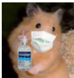
Figura 3 — Sticker de conscientização.