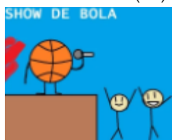
Figura 1 — Show de(da) bola.

quando trabalhada integrada aos elementos constituintes da imagem – sendo eles a bola, o palco, o microfone, as pessoas se divertindo –, nota-se que ela ganha um novo sentido, ou seja, de um show que está sendo realizado por uma bola. Logo, observa-se que é exatamente a partir da integração entre o texto escrito e o texto visual que o efeito de humor é produzido, já que, vistos de forma isolada, não atingem o leitor com a mesma comicidade.